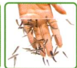
ドクターフィッシュ「ガラ・ルファ」