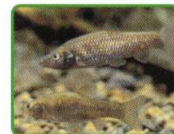
横内川に生息する魚などの展示

横内川、浅瀬石川に生息する魚の他、ドクターフィッシュ、南国オカヤドカリなどを展示します。