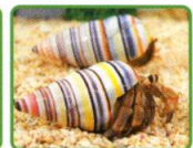
カラフルな南国オカヤドカリ