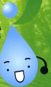
青森市水道キャラクター「しずくちゃん」