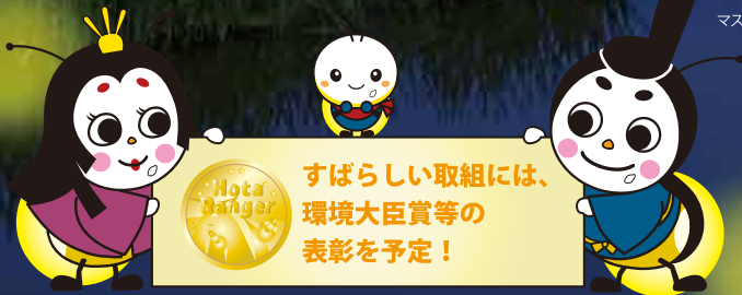
姫ママル・ホタルン・源氏ハハル (米原市)