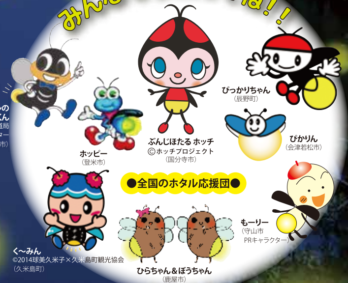
ホタルの 澄都(すみと)くん 京都市上下水道局 マスコットキャラクター (京都市)