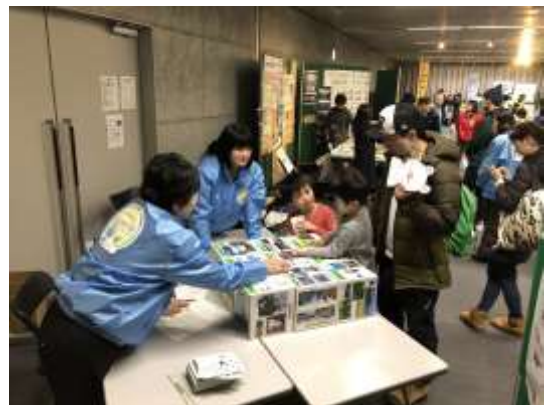
環境フェアのブースの様子

現在、第5期地球温暖化防止活動推進員として、14名の推進員がそれぞれの経験と知識を活かして活躍しています。皆さんも一緒に活動してみませんか。