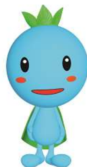
青森市環境保全シンボルキャラクター 地球の王子様「エコル」