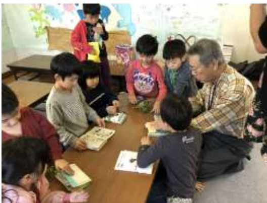
推進員による出前講座の様子