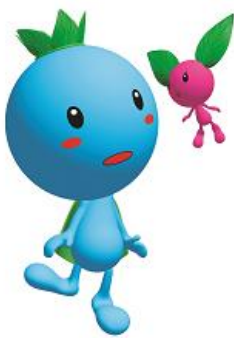
青森市環境保全シンボルキャラクター 地球の王子様「エコル」＆「ハナ」