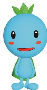
青森市環境保全シンボルキャラクター 地球の王子様「エコル」