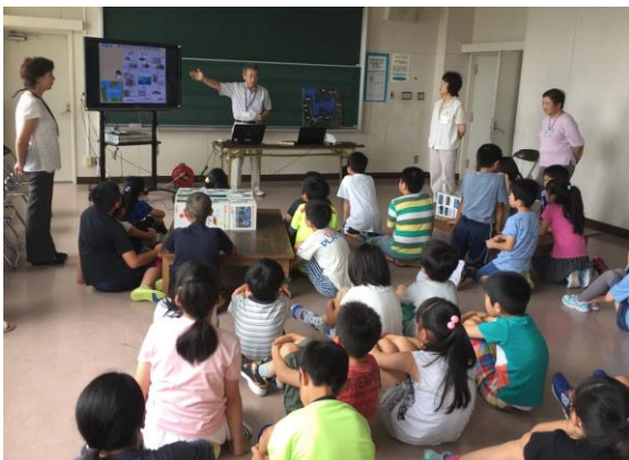
推進員による出前講座の様子