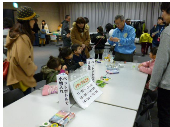
環境フェアのブースの様子

現在、第4期地球温暖化防止活動推進員として、13名の推進員がそれぞれの経験と知識を活かして活躍しています。皆さんも一緒に活動してみませんか。