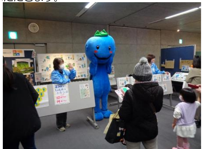
環境フェアのブースの様子

現在、第6期地球温暖化防止活動推進員として、11名の推進員がそれぞれの経験と知識を活かして活躍しています。皆さんも一緒に活動してみませんか。