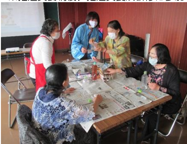
推進員による出前講座の様子