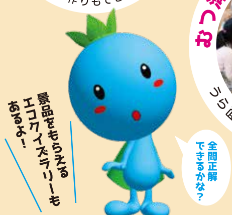
青森市環境保全シンボルキャラクター 地球の王子様「エコル」