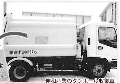
伸和産業のダンボール収集車