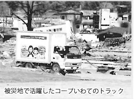
被災地で活躍したコープいわてのトラック